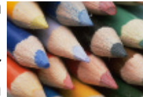
Kreativität hilft auch beim Lernen