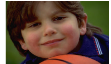
Kinder lieben Bewegung

Durch die gute Kooperation mit der Heinrich-Neumann Schule können wir die vielfältigen Möglichkeiten der schulischen Räume nutzen, z.B. den Werkraum, die Küche, die Turnhalle, die Aula. Wir können den Kindern Rückzugsmöglichkeiten bieten, wenn sie aufgrund ihrer Besonderheiten eine Pause von der Gruppe brauchen.